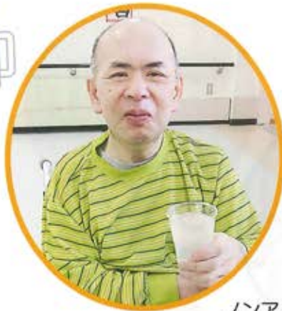
ノンアルコールで一杯