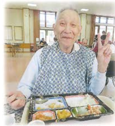
秋の味覚いっぱいです