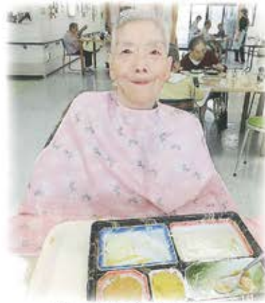
いっぱい食べるぞ！