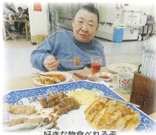
好きな物食べれるぞ