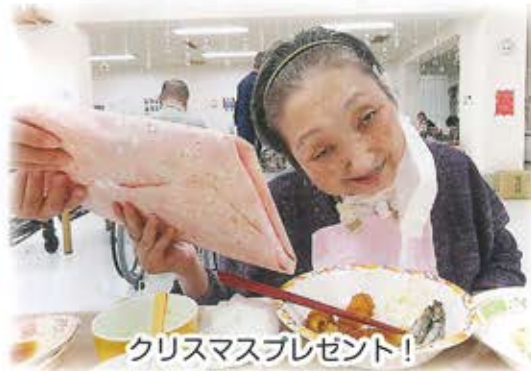
クリスマスプレゼント!